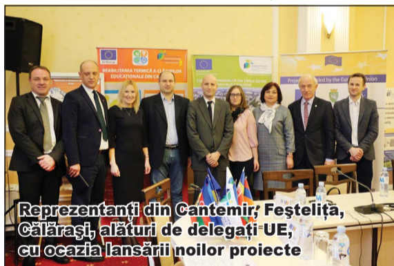
Reprezentanți din Cantemir, Feștelița, Călărași, alături de delegați UE, cu ocazia lansării noilor proiecte

„Dezvoltarea eficienței energetice și a energiei regenerabile reprezintă unul dintre aspectele cheie ale dezvoltării economice durabile, iar Uniunea Europeană (UE) este convinsă că municipalitățile joacă rol crucial în acest proces. Prin intermediul