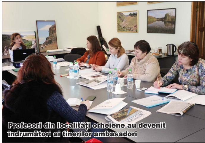
Profesori din localități orheiene au devenit îndrumători ai tinerilor ambasadori

Proiectul „Tinerii din Orheiul Vechi – vocea pentru promovarea durabilă a rezervației” a început cu o masă rotundă dedicată profesorilor de biologie/ geografie/ educație ecologică din cele 8 școli care se află în arealul Rezervației cultural-naturale „Orheiul Vechi”, desfășurată pe data de 15 martie. La acest eveniment s-a discutat despre potențialul cultural-natural al Rezervației, activitățile extra-curriculare pentru copii în vederea promovării educației ecologice și creșterii atașamentului față de plaiul natal. Pe parcursul lunii aprilie profesorii vor organiza 32 de excursii la nivel local (câte 4 excursii în fiecare din cele 8 localități), în cadrul cărora elevii vor vedea cu