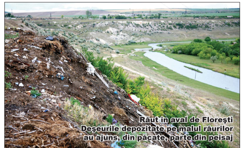
Răut în aval de Florești Deșeurile depozitate pe malul râurilor au ajuns, din păcate, parte din peisaj

• Strămutarea depozitelor de fertilizanți din zonele de protecție a apelor;